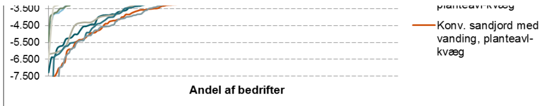
Figur 1. Spredning i rest til jordleje ekskl. EU-støtte

I figur 2 er "Rest til jordleje ekskl. EU-støtte" sorteret efter størrelse for planteavlsbedrifter med planteavl eller svineproduktion som hovedproduktion. Bedrifterne er opdelt i 20 grupper, hvor hvert punkt således udgør 5 pct. af bedrifterne. I figuren ses gruppernes gennemsnitlige opnåede "Rest til jordleje ekskl. EU-støtte" og deres tilhørende "Beregnete jordleje korrigeret for EU-støtte".